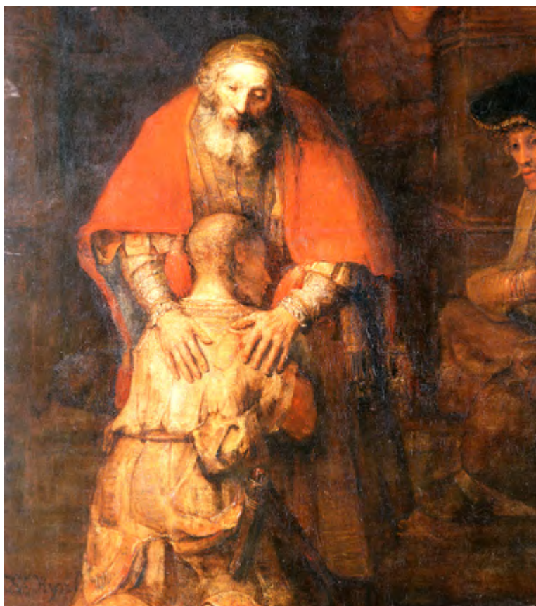
Rembrandt van Rijn: Die Rückkehr des verlorenen Sohnes, 1666-69, Öl auf Leinwand, 260 × 203 cm, Ausschnitt

ABKÜNDIGUNG VON KASUALIEN FÜRBITTENGEBET